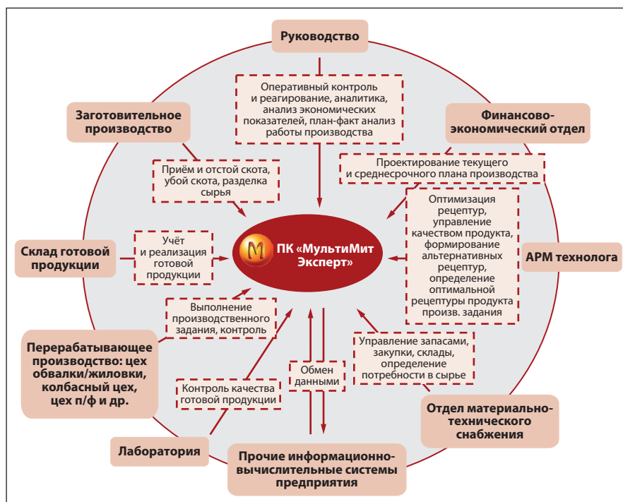
Рис. 1. Схема применения комплекса «МультиМит Эксперт»

Программный модуль «Экспертная система диагностики и анализа качества рецептур» служит для диагностики и анализа качества рецептуры мясных и рыбных продуктов, выявляет технологические проблемы и предлагает варианты их решения. При анализе рецептуры учитываются физико-химические, функционально-технологические и структурно-механические свойства сырья и рецептурных ингредиентов. На основе этого модуля выполняется уникальная операция по определению оптимального набора пищевых добавок, которые корректируют качество продукта и применяются для устранения потенциальных